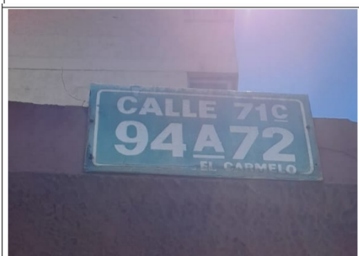
Foto 7.- Nomenclatura de visita.