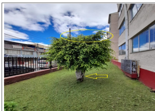
Foto 5.- Foto general evidencia del descope de un individuo de la especie Caucho benjamín ( Ficus benjamina ).