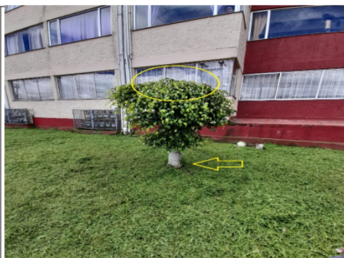
Foto 6.- Foto general evidencia del descope de un individuo de la especie Caucho benjamín ( Ficus benjamina ).